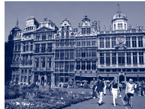
Grote Markt van Brussel.