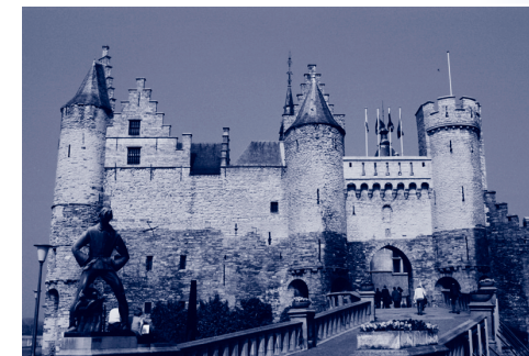
Het Gravensteen in Gent.