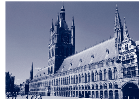
Belfort van Ieper.