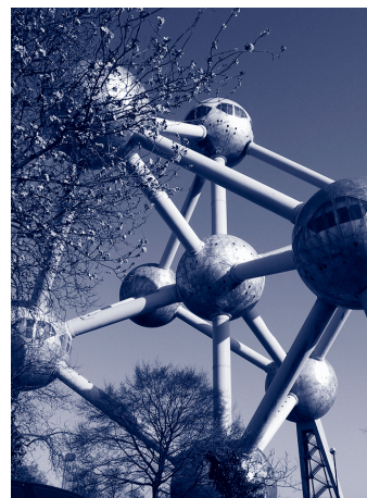
Het Atomium in Brussel.