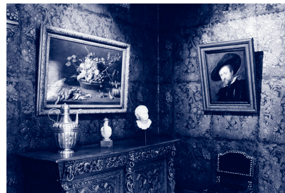
Voorwerpen tentoongesteld in het huis van de barokschilder Pierre Paul Rubens in Antwerpen.

België beschikt reeds over een aantal schuilplaatsen voor kunstwerken (Koninklijke Musea voor Schone Kunsten, Musea voor Kunst en Geschiedenis, Musée de Mariemont...) 89