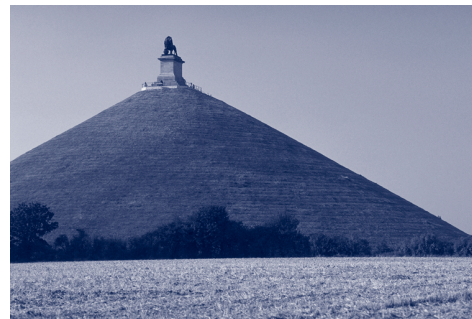
De Leeuw van Waterloo.