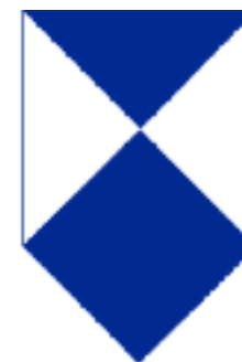
Kenteken voor culturele goederen onder algemene bescherming

Dit kenteken vertoont "een naar beneden gericht schild, gekwartierd in een azuurblauw zilver schuin kruis (boven een blauw vierkant, waarvan één van de hoeken in de punt van het schild past, komt een driehoek in dezelfde kleur, waarbij beide aan weerskanten een witte driehoek afbakenen)". 40